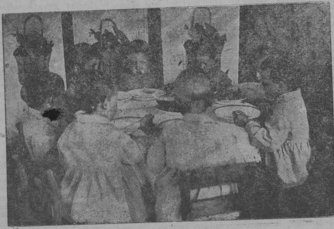
Снимок выламы: Сыктывдинса образцовöј детсадын челад öбöдајтны.

невеокыда. Тајö-ли абу самокритика пöдтöм? Ковмас вiставны, кушöма мијанлы отсалöны i партијнöј организацијас. Тани вескыда колö шуны, мыј омöла сетöны отсöгтö комсомоллы партијнöј организацијасыд. Ми кыммыны-ниң корлм райкомлыс коммунист-пропагандистјасöс, но öнö-на нiдi коммунистöс ес сетны. Ми возö ужкын, кодi мијан вочыи сулалö вывтi ыжыд—воспитатöм уж—витчысам ыжыд отсöг партијнöј организацијассан.