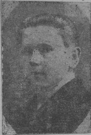
Јукөн—студөнт-ударнөк ВУЗ-ө гөтөвөтан курскас вылыс.