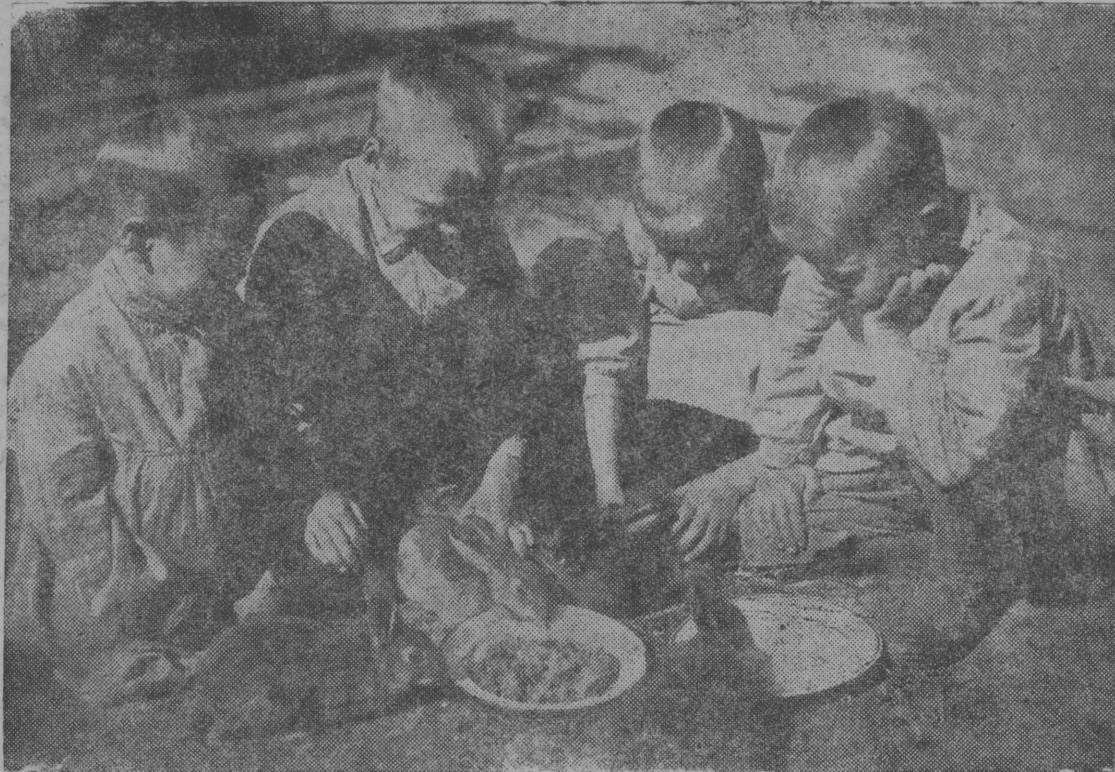
Сѡмокс вылыс: Сыктывкарса образцѡвѡј ѡтсадын чѡлад верѡѡны кроликјасѡс.