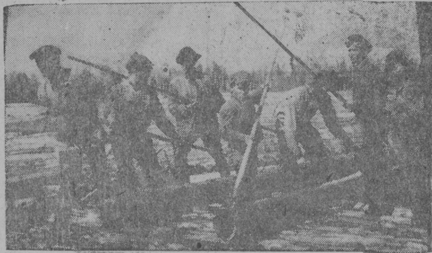
Снїмок вылын: Пурјалӧм плїта вылӧ катлӧны накатјас.