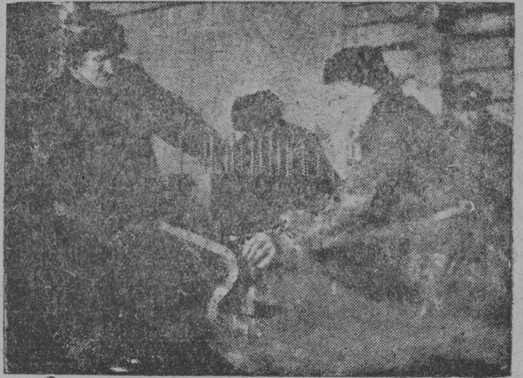
Снимок вылын: Час тракторнöй базаыс ремонт вöчан бригада (Лыжуров жортлөн).