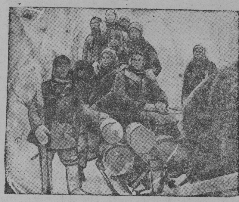
Çassa komsomolъsko-molodъznæj brigada vьrkьskalæmьn

Komsomolъskæ organizacijajasљь kolæ vizædlьnь asovozљьs vьlæ, boљstнь najææs vьdlunja tædzьsæm ulæ, ųetнь setçæ komsomolъcъjasæs da udarnik-љasæs. Kotьrtнь uzsæ asovozљьn ob-razcovæja, setьs klassovo-çuzdeј ele-mentjasæ vesalæmañ.—so kueam mog sulalæ komsomolъskæ organizacijajas vozьn.