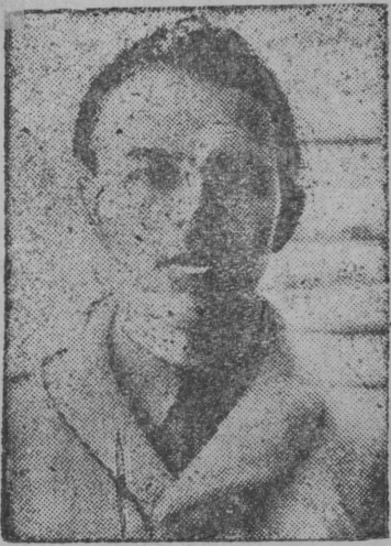
Lestexnikumbs G. K. Vasiljevskij—voštis 400 sajtə premija