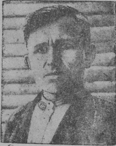
Lestexnikumbs S. A. Juskov—voštis 130 sajtə premija

S. A. Kostarevəs premirujtəma 110 sajtən. Socordjysəm kuza askəşjəmsb pərtə oləmə bura. Uzalə VLKSM jacejkasa šekretarən. Velədə kojməd kursbn. Ušpevajemošt vylən.