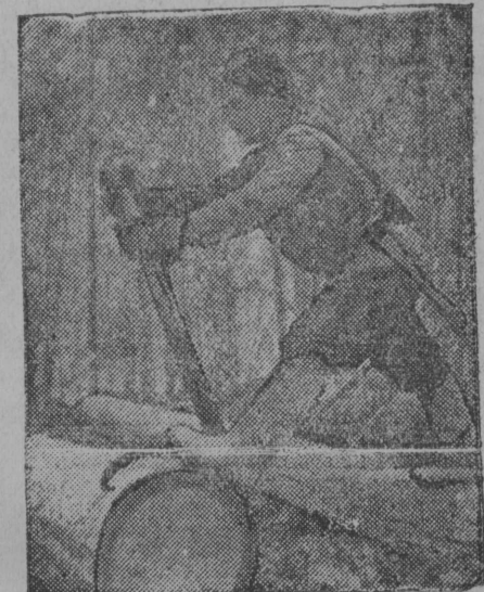
Звучнöй бригадыс шлен вöчö-6 кубометр Койгородок подвеснöй вöр пунктыс.