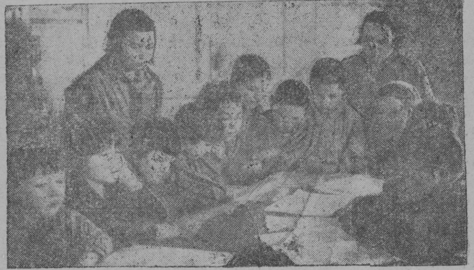
Пионерскј чьвено велодчю.

Тані ставыс медым виц-му хозяйствонн ко- саонн ыдыд количество да бур качество вьсна тышкаоны, суодны да паньыны техни- ка боксан воцын муныс капиталист страна- јасос.