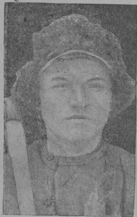
КҮШЕ ВҮЛҮН: старшөй бригадѳр удәрнөй-хозрасчөтнөй бухгалтер јушөй бригадамө Пыстын Нѳ.