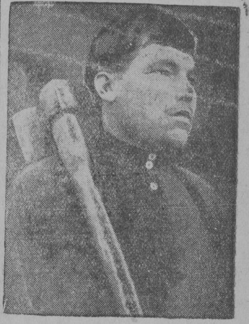
МОТОРИ—Ударник-плöк тыи вьль лесзавод стрöитаныс.

ВЛКСМ ОК бжуро вылын Сыктывдин райкоммола секретар — Колесов жорт зав. гöгралöмөн пöржавны ОК-öс, игуис —ЦК-лыс-пö шуöмсö жачежасак проработатисны собранныöжас вылын, а кор жуалисны, кымын комсомольч. колхозникöс вöли кыскöма ЦК-лыс шуöмсö проработатны да кымын мöслыкөсө район паста — виставны ез вермы — ог-пöтöд, — шуö. Öткымын КСМ жачежасак сыскöтсöс бура вяжым понда öз төждыны. Район паста мöсжас 50 пр. мында кукжас вайдны кулöмөн. Прөндорын ем комсомольскöдй скöтвячан карта, но сижöс нежучöм ногөн оз пож шуны комсомольскöдйөн. Картаас-кө летчан—пырны он лыет нажысла да дуркысла.