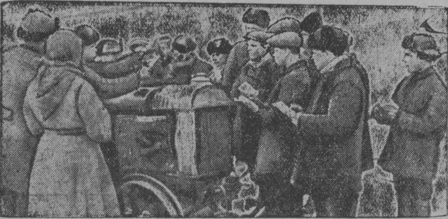
„Комі автономіјалы 10 во“ ыма совхоз велөдө трактористјасө с.

Смотр-конкурс нуодом топыда јитны вөркылөдөм да гөра-көза успешнөја нуөмкөд