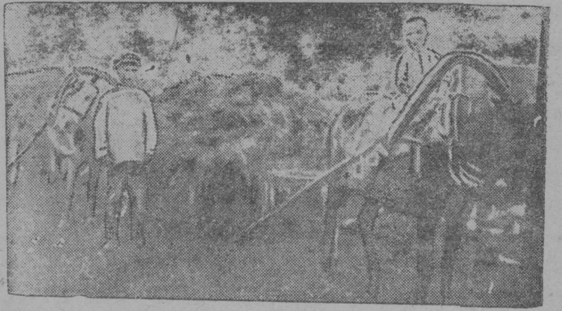
„Ордым“ колхоз кыскало ид вундом ббрын вартом вьл.

Комсомол организацијаслы локны организованноја. ВЛКСМ Горком.