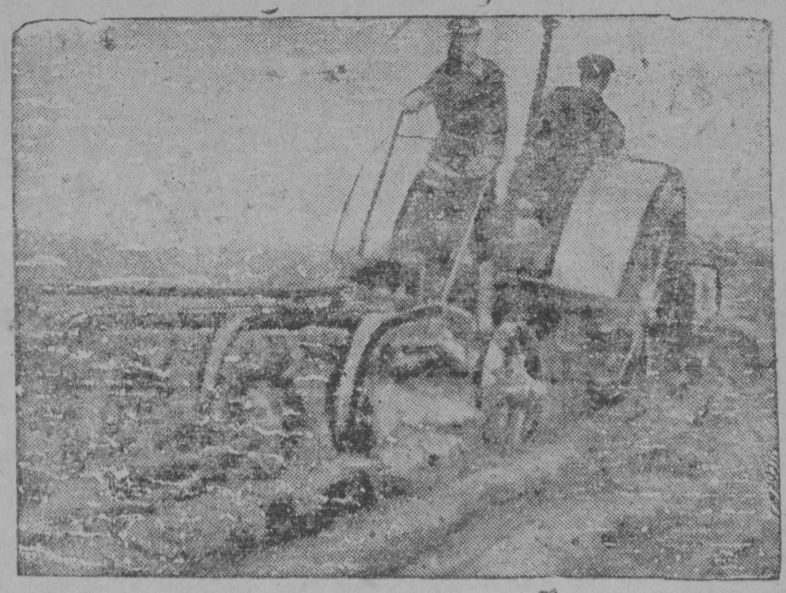
Визинса МТС-ыс трактор гөрө колхозлыс му.