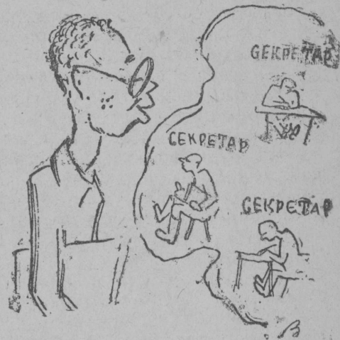
Төдöны сöмын секретаржасöс

Билет вежлалöм вонын-кö вöли сулалö мог—комсомол организацијае прöверитны классöвöй суслунсö, организацијае весавны ковтöм (чуждöй) элементжасыс, кыпöдны организацијае классово-политическöй боеспособностсö да производственнöй активностсö, вöвлытöма бурмöдны вескöдлöм, быд комсомолечöс төдöмөн.