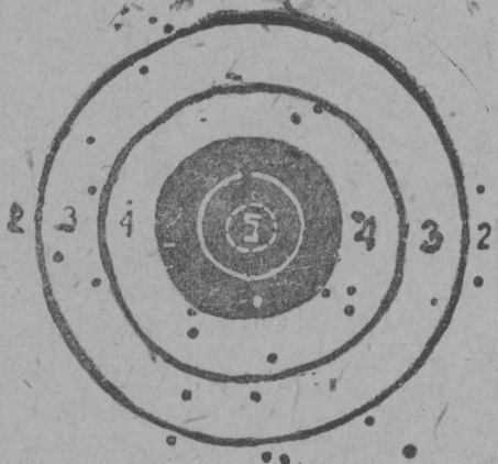
Сыктывкарса учпунктын 1-ј взводса 4-өд отделеннөдөн лыҗлөм мишен

33 велөдчән вөса контролнөй цыфрајас тыртөмсө. ВЛКСМ Крайком шудмјас серт до призвннөй арлыда став комсомолчјасдс (1913-13-өд воын чужысјасдс) да тајө арлыда уна б/п. том јөзөс колө вөли кыскыны воҗеннөй обученнө, 120 часа программаң Осоавиахим учебнөй пуктјас пыр.