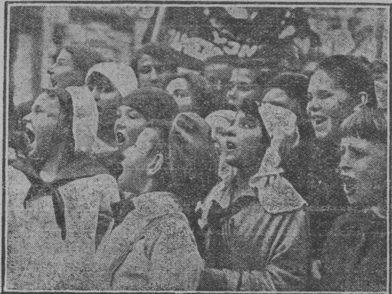
Серпас вылын: Мoскуаын мај 1-д лунö пионөрјас чолөмбытöбалды демонстрантјасöс.