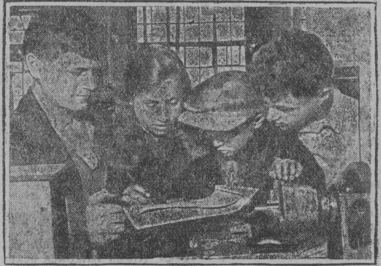
Герпас вылын: „Амо“ заводыс ФЗУ-н велөдчысјас гөжөыны зајом выльө.