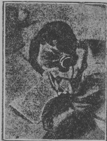
Герпас вылын: роботыча кывзө урок радио пыр.

Москва РСФСР-са ВСНХ-лөн президиум шыс Сыктывкарса индустриальнөй техникум реорганизујтны кык самостојательнөй техникум—лөбө строительнөй да электро-тепло-механикескөй техникумјас. Та кыңи шүөма Сыктывкарө востыны горнөй техникум. Выл техникум организүтны шүөма заводитны 1932 воө.