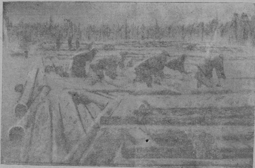
Шџјнатыса ударнџј нывбаба бригада вџрын