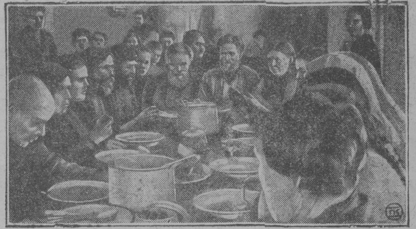
Берпас вылын: „победa“ коммунаын олыгјас өбөдајтөны.