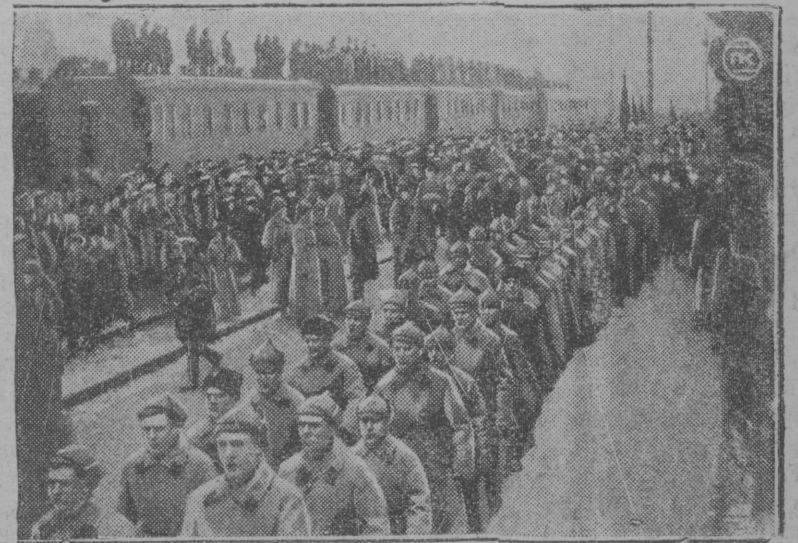
„дальневосточнөй фронтын тышкасыөјаслы вокзал воэса площа вылын вөсталисны чолөмјас мөскуаса фабрик заводса представөтельјас.

Мөскуаө воисны Китај граңица вылын тышкасыөјас. Раңитчөм да вөсыс бөјецјас.