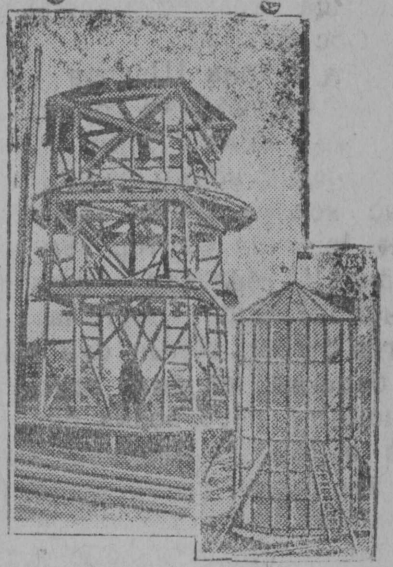
Картина вылас: Сїмоновскөј вөрпїлітан завод вылын башна вөчөм. Уліас вөчөм башна, выліјас вөчөд-на.

пөденціна, кодјыны-кө 2 метраш жуэыджыка. Сїэ-кө медым ескө кодјыны гу—траншеја 50 тонна өілөс вылө ковмас перјыны 124 кубөметр му, кытчө ковмас 40 пөденціна.