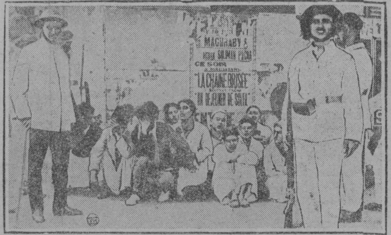
Индіја бӧрса сувтӧны кос вылӧ мукӧд колоніјаса јӧз имперіализмлы паныд. Неважӧн-на Јегіпетын вӧліны столкновеньӧјас натсионалістјас-лӧн англійскӧй војскакӧд.

2-3 комсомолеч. Біографіјаса комсомолечјас велӧдчӧны шогмытӧма. Заџатӧ вылӧ воывлӧны 30-50% ст. комсомолечјас пышкыс. Беспартіинӧй том јӧзӧс велӧдчыны абу кыс-кӧмаӧе. Біографіјаса комсомолечјас ӧнӧч-на промфинплансӧ абу јӧздӧмаӧе, а кор оз кут тӧдны промфинплансӧ, кутісны шуны, абу-нӧ реалнӧй. Вӧтвеса планлыг кејмӧд во тырӧмсӧ стречайтны налӧн ынӧмӧн.