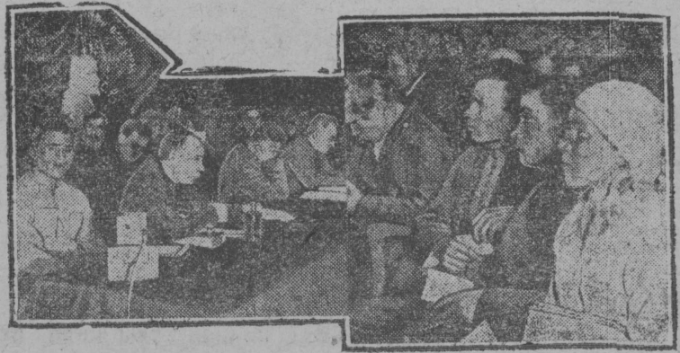
Картина вѣлын: шугаладорас конференцѣяса президиум; веекыдвѣлас ударник—трактористяс кызвөны доклад.