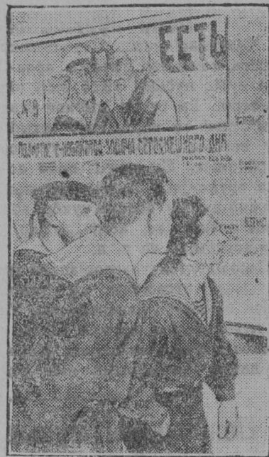
Герпас-вылын: Конферөнтсјаса дөлегатјас өтенө өшөдан гөзөт-дорын.