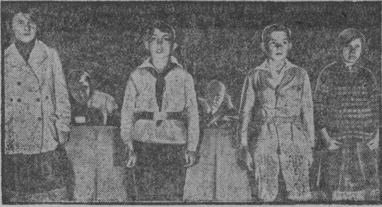
Піонерјас пріветствуйтны сјездсё.