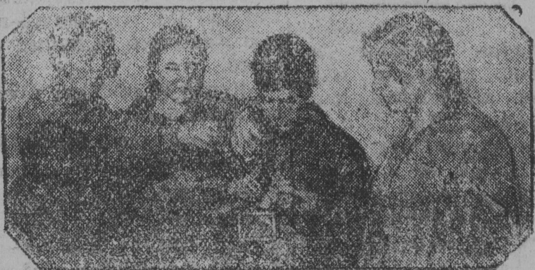
Лагерё мунём-вылб піонерјас чукёртёны өбм өбм чбжан кас-саса копїлкаб.