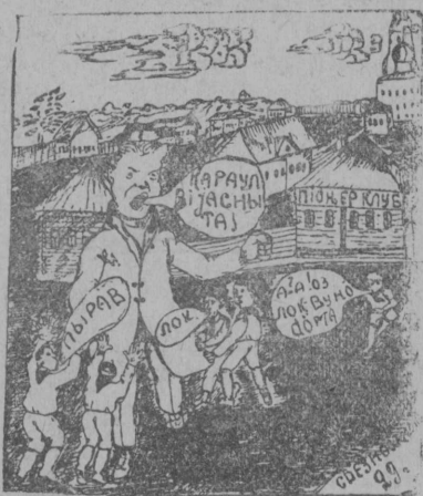
Кызі мукөд дырјыс лоө кыскыны комсомольчјасөс піонер уж вылө.