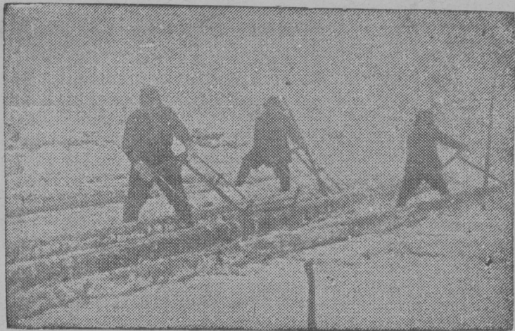
СНИМОК ВЫЛЫН: Тракторён трелойтöм кер раскряжуйтöны складын (Кряжск öй механизированной вöрпункт, 2-öд участок).

лысьяс тöждысьöны омöля. Например, рабочийяслы оланиньяс пескөн оз обеспечатны. Общежитиеясын олöны стеклötöм лампаясөн.