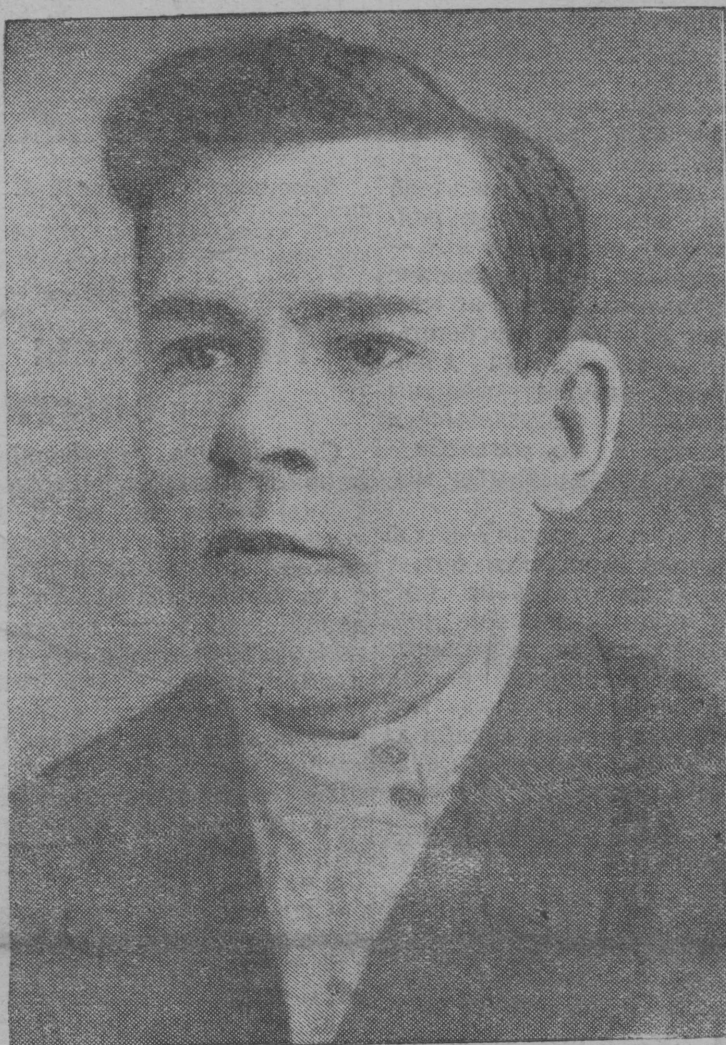
ПАВ. ИВ. БЕЛОВ—Кряжскса механизированной вёрпунктысь вёрлэдзысь-стахановец Готчиев метод серти уджалёмён, нормаясёсё быд лун тырталё 180—200 прёцент выло.