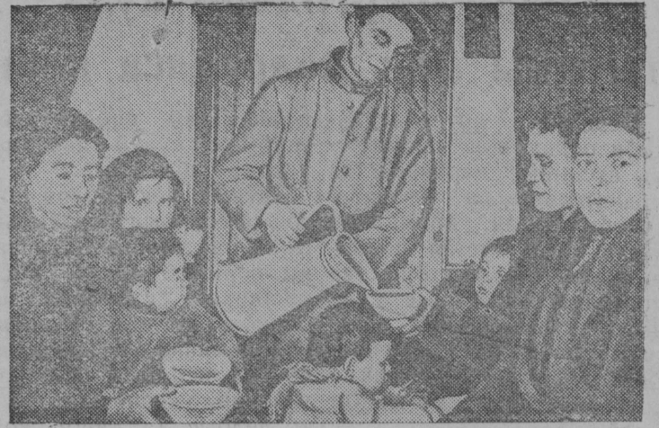
СНИМОК ВЪЛЫН: Франциян каталонияса беженецъяс—нывбабаяс да челяль—концентрационной лагерө мунгөн получайтөны ассыныс скудной обөд.

ЛОНДОН, 17. (ТАСС.) „Дейли телеграф энд Морнинг постлөн“ дипломатической обозреватель гижө, мый Испанской Марокконын войскаяслөн лыдыс ондз эз вөвлы 30 сюрсыс унджык. Оня кадын таня концентрируйтөма 90 сюрс морт. „Бритиш юнайтед пресс“ агентстволөн танжерской корреспондент юөртө, мый бөръя кык лун-ной Испаниясыс Испанской Марокко мөдөдөма 12.000 салдатс. Мөдөдөм частьяссө концентрируйтөма Танжерын международной зона дорын. Сы кындзи, юөртө сийө корреспондент, 25.000 итальянецсө чукуртөма Кадиксө, Альмерия да Аликанте. Испанской берегысө 40 военной корабль составдн германской эскадра матыса кадын во-омкөд йитөдын полөны кызди эськө Танжер „эз ло фашистской государствояслөн захватнической зилөмъясын выль объектн“. „Бритиш юнайтед пресс“ агентстволөн гибралтарской корреспондент юөртө, мый Испанияса лунвыв юкөнын, Гибралтар районын паськыда нудсөд антибританской кампание.