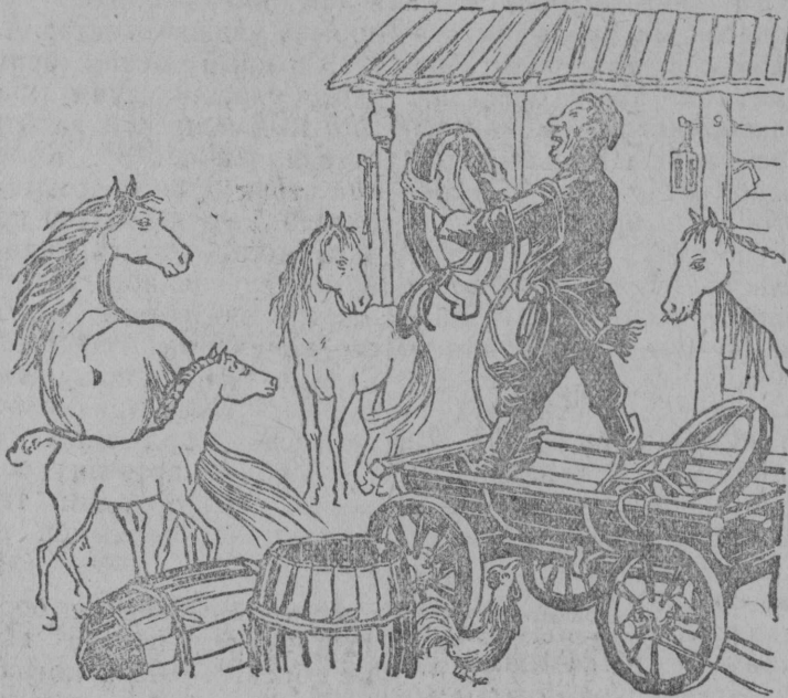
— А, но ко, кодлөн тайө сийөсыс?! Матыстчөй!

Паль да Провдор сельсөветуьса „Красная Армия“, „Коммунар“ да „Ленин туйөд“ колхозьясын вөвьяскөд вөдитчөны лөка. Вөвьяс вердастөмөсь. Сийөс көлуй өмөль состояниенн. (Селькор письмөсь)