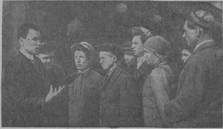
Снимок вылын: Антинской района (Татарской АССР) колхозникъяслөн группа Арск станцияын Дальней Востока промышленностигö уджавны мунöм водзвылын.