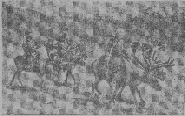
СНИМОК-ВЫЛЫН: Мѳд пятилетка нима Эвенкийскѳй колхозлѳн охотничей бригада мунѳ кыйсыны тайгаѳ.