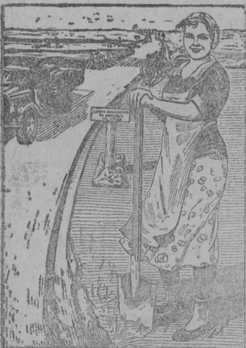
КОЛХОЗНАЯ ВОРОННАЯ БРИГАДА—ЛЮБИМАЯ ФОРМА УЧАСТИЯ СЕЛЬСКОГО НАСЕЛЕНИЯ В СТРАХОВАНИИ И РЕМОНТЕ ДВЕРЕЙ