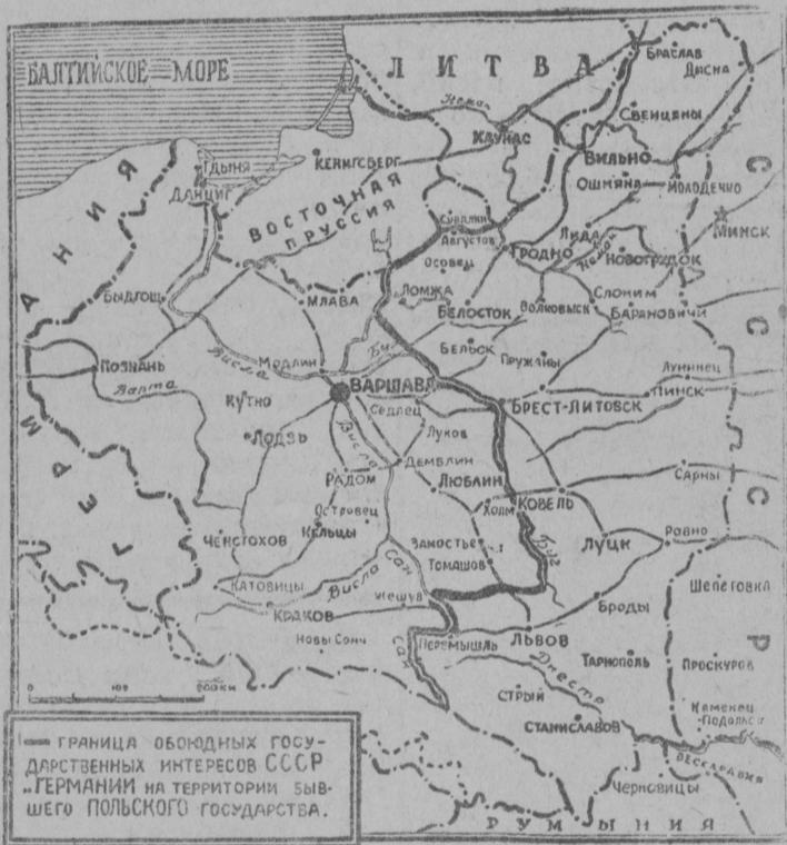
Граница обьединенных государств интересов СССР и ГЕРМАНИИ на территории бывшего польского государства.

гайтбны, конференция выльб Индияб корбмсб вблб вбчбма индийской национальной конгресс жмитбм улын, кодб война кыптбм бьрын нудбб Индиялы медьёна полной автономия сетбм вьсна интенсивной кампание.