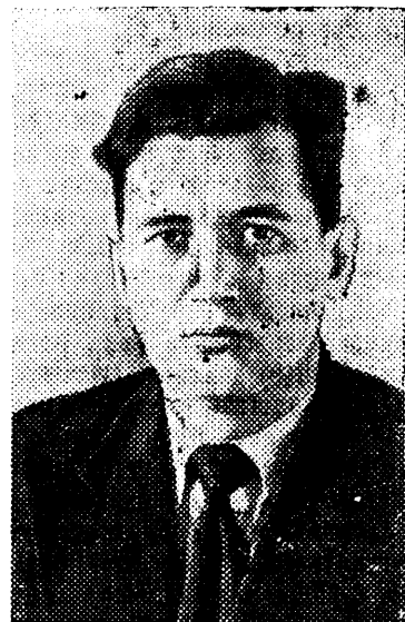
Гончар Александр Терентьевич—дважды лауреат Сталинской премии, писатель. Премия второй степени присуждена в 1947 году за роман „Знаменосцы“. В 1948 году А. Т. Гончару присуждена Сталинская премия второй степени за роман „Злата Прага“.