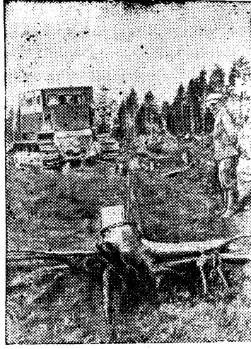
Костромская область. Выполняя постановление партии и правительства о трехлетнем плане развития животноводства, в совхозе "Караваново" приступили к созданию прочной кормовой базы. Успешно идет раскорчевка пней на площади 300 гектаров. Вся эта площадь будет засеяна травами. На снимке: раскорчевка пней в совхозе.

Через улучшение работы с агитаторами поднять идейный уровень политической агитации в массах и в сочетании с организаторской работой добиться досрочного выполнения обязательств, данных товарищу Сталину, — такова задача всех партийных организаций округа.