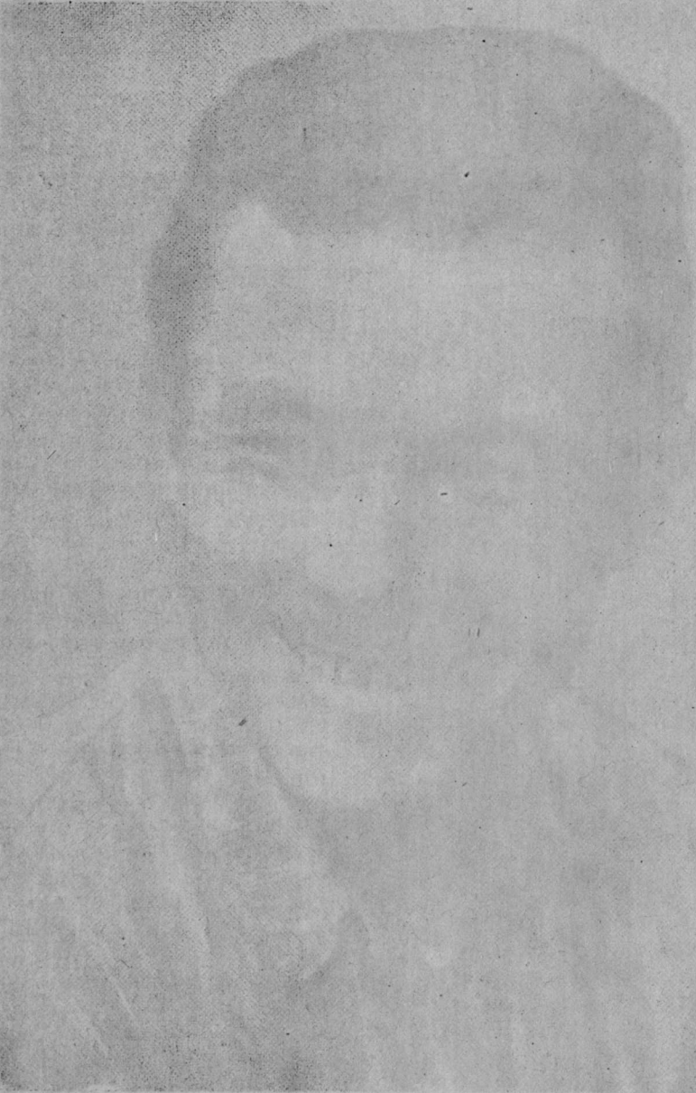
Portrait of a man, likely a historical figure, shown in a dark, high-contrast image.