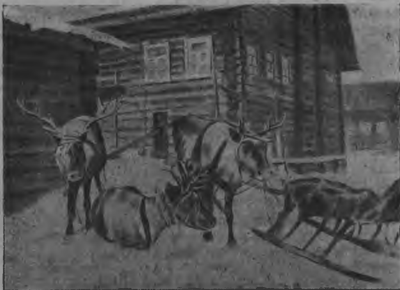
Комі олөмыс. Көрјас доф-алөмөн.

Коркө і Јаткаё воісны... Вөт-коф зик олөмыд! Воісны рытын. Педёс нуөдіс Јакө-Ірина-ордө; сіјө сетчө мунөма верөссајө. Ірина вөлом патератө вежөма. Војбыд корсыісны. Сөмын мөд луннас луншөркад-гөгөр адзісны. А местатө кущөм корсөмыс вөлі!