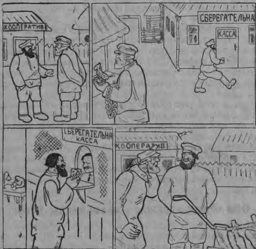
Кассаын-кө өм чөжан, кокныжыка плуг ботан.

Сөм-чөжан-кассаыд пуктөм гөмгыд мынтө ыжыд прөцент. Војдөр, револутсіјаоџ, гөм-чөжан-кассајас мынтөны вөлі во-гөгөрөн сөмын 3,6%. Револутсіја-бөрын мед-воҗсө мынтылісны 4%. Öнi, 1926 вога август 11-өд лунгаң, строк урчiттөг-кө сөмтө пуктан, сетөны во-чөжөн 8%, а строкдн-кө пуктөма,—воөн 9% (9 ш. 100 шайт-вылө во-гөгөрөн).