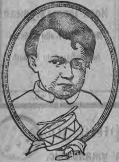
Льенін 3 арөсөн.

Льенін-јортлөн велөдөмыс, ужалөмыс вајис зев-ыжыд бур став-мувывса ужалыг-јөзлы. Сіјө індіс, кызі поэд мездыны озырјас кі-подулыг. Быдлаын, быд пельсын өні ужалыг-јөз төдөны Льенін-јортөс, зілөны мунны Льенінөн індалөм туйөд.