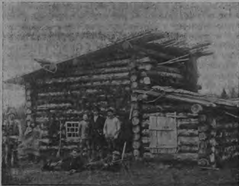
Комі олөмыс. Вөр-керка.

— Öгрөйдлы секи вөли ар даскујим, а Öданыслы өкмыс-гөгөр. Јельеныд најөс куртны ыстөма шор-дор-виқсө, агныс мунөмабө ыщкыны-жө Јегыр-бокө. Вөлөма сјө Ільалун-вечернаө. Муфер мортыд-öd быдлаө арталө: кык нылкаыд-пө куртасны, празнык рытнае зорөд чөвтыштасны.