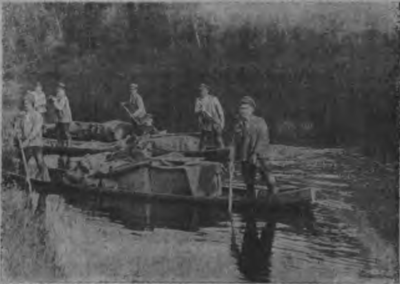
Ізвајылӧ тӧвар вајӧм.