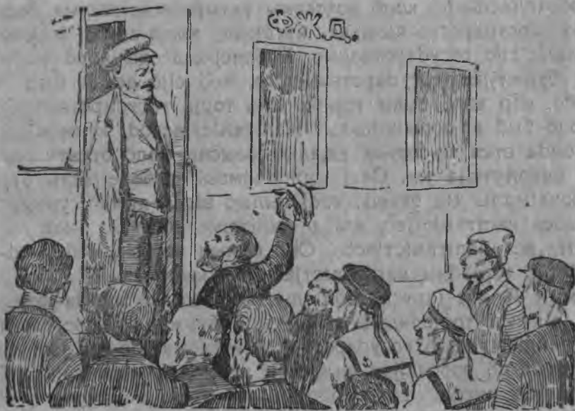
1917 воын, апрелын Лєнин воис Росејаб. Вокзал- вылын.

Лєнин-јорт јешцө даснол во-сајын-на вөлі шуө, сөмын-пө са-рөс да помешщкјасөс шыбытөм-бөрын став ас-горняа јөз вермас-