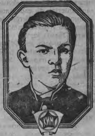
Льенін 16 арөсөн.

ас-горнія јөзөс-пө колө увтыртны, морт-тујө не пуктыны. Тајө долөмыс озыр-јөзлөн роч ужалыгјаслы јурас пырөма-нын вөлі, да најө вылысаң-жө віқөдісны ас-горнія јөз-вылө. Тақі віқөдөмыс омөлсө