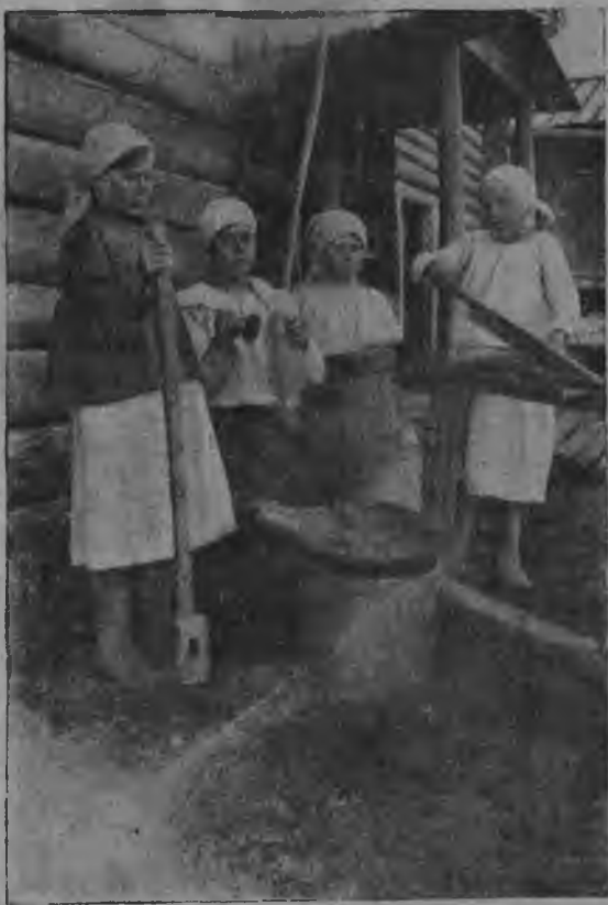
Нывјас кудель кероны.

индыны і учрежденьеясын ылучкы уж-мундымы, щоктоны ылучкы торжасо быродны. Оти олома-баба висталис: сетлома сijo корко судо перыны кагалы алымент. Кык во-нын ыжалома делыс. Лоома локны Сыктывдин-каро. Сени кык лун суздодма оти ыыжыд справка: оти-по ыстас мод-доро, мод коймод-доро... Коло-по пуктыны пом тацом торжаслы.