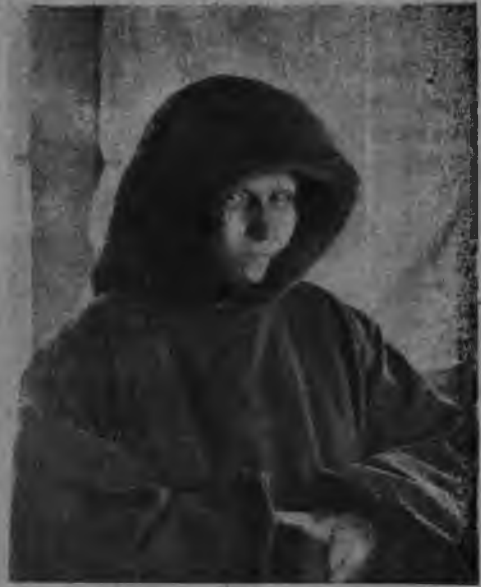
Ізваса комі нывбаба

Комі крестанка 1922-23 во- јасо советјасыо ылын, боқын кыщлаліс. Өні ачыс сені ужало, бөрјө ужнуодыгјасос. Таво сө- ветјасо бөрјөісны 23.704 ныв- баба, 60.425 нывбаба-пыо. Вө- лөстувса сјездјас-вылө бөрјөісны 519 нывбабаос (12,72%). Вө- лөстувса ісполкомјасын шлен- ын 54 нывбаба (кольом во волі сөмын 5 нывбаба). Комі аң ас- лас вөлөстувса совет-кынңі, бөр- јө да нуөдө ужсө ујездувса, областувса советјасын. Кольом во воліны бабајас ујездувса сө- ветјас сјезд-вылын 17 морт, таво —25 морт. Областувса советјас сјезд-вылын кольом во воліны 6 нывбаба, таво—19-өнөг.