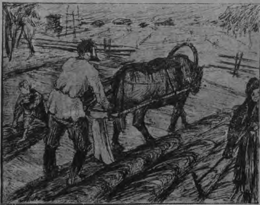
Гөрө гөрјөн, весіг пу-гөрјөн. Колө заводитчыны плугјөн ужалөмө.

Мед крестәнинлөн овмөсыс өјдөжык кутис кыптыны, колө сылы öнi јонжыка заводитны велөдчыны, јонжыка јуагны агрономјасыс, возвыв лёсөдны план, кущөм уж да кор сјјөс вөчны.