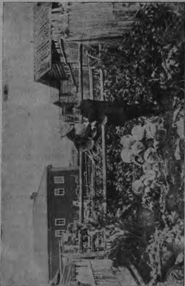
Капуста градјөр Гъваын.

Капустатө пуктөм-мыгы-кө кутас жона зерны да град-вылысыс (жонжыкасө сојму-вылын) коркаалас, колө коркасө жугөдлыны кiөн. Мытчысөм јогсө колө нещкыны, мед оз мешајт быдмыны том-на, слабiнiк капусталы. Төлыг-мыгы-кымын град-вылө пуктөм-бөрын, капуста быдмас 4-5 вершөкөз. Секи сiјөс колө бугрiтны. Вежон