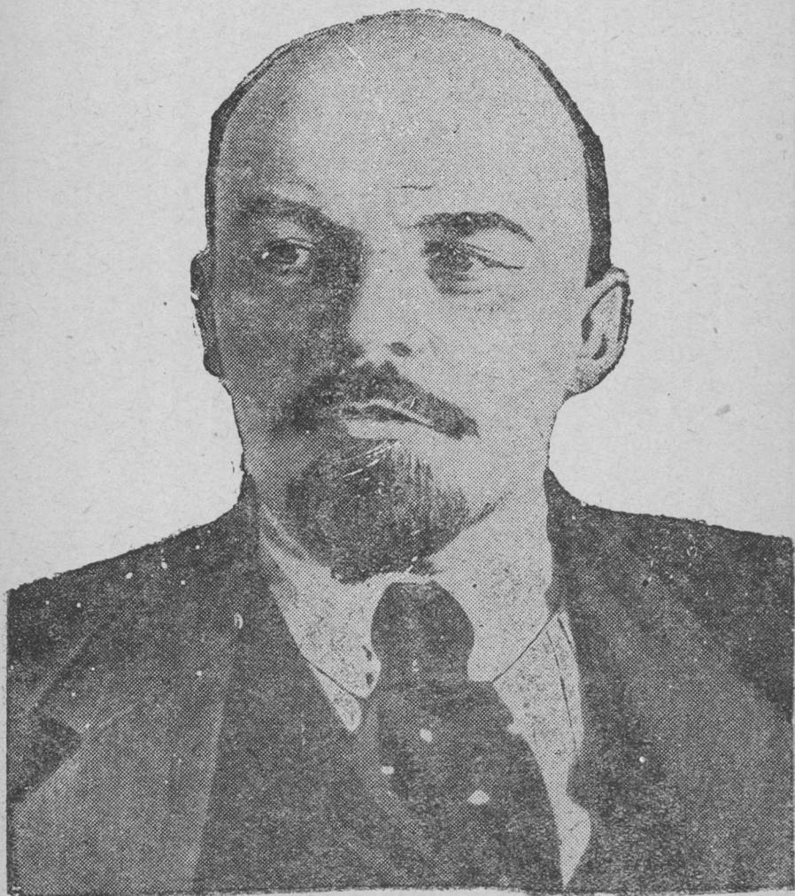
В. І. Ленін.