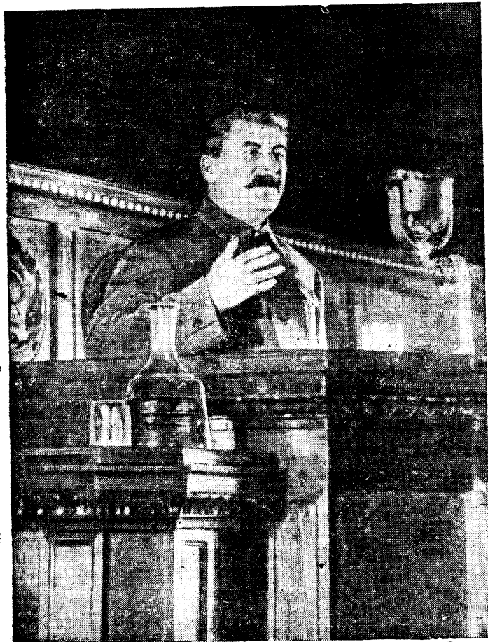
Товарищ И. В. Сталин на трибуне VIII Чрезвычайного Всесоюзного Съезда Советов.

Конституция СССР является единственной в мире до конца демокра- тической конституцией. И. СТАЛИН.