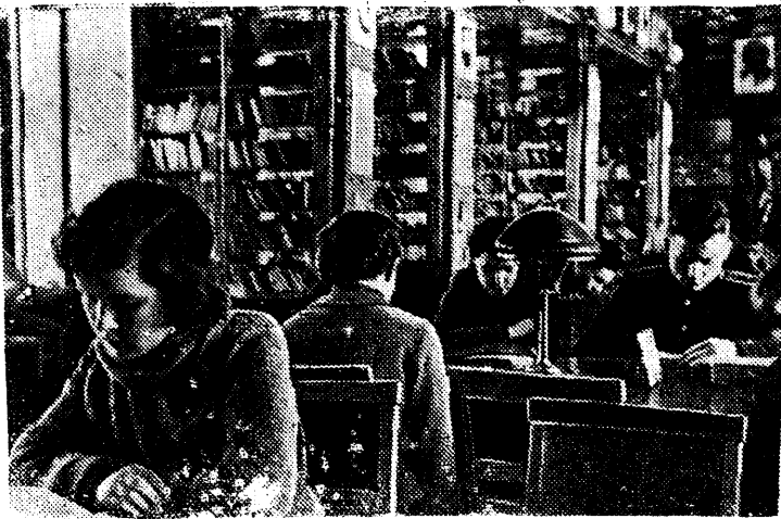
Отдел детской и юношеской литературы Государственной библиотеки СССР имени В. И. Ленина обслуживает ежедневно до 800 юных читателей.

Активным участием на путине комсомольцы и молодежь окажут большую помощь партийной организации округа в борьбе за выполнение государственного плана рыбодобычи 1945 года—важнейшей хозяйственной задачи, стоящей перед округом.