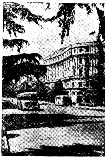
Гостиница "Тбилиси" на проспекте Руставели в Тбилиси.