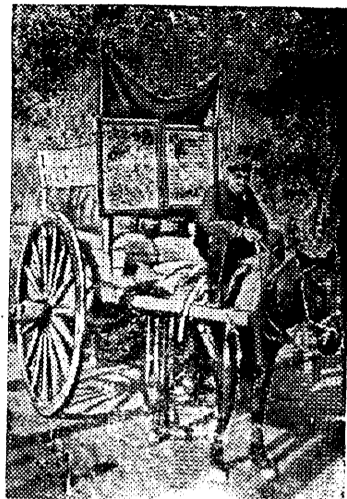
Колхозники Узбекистана отправляют рабочим промышленных предприятий красные обозы с продуктами из своих личных продовольственных запасов. На снимке: Колхозники сельхозартели имени Сталина (Ярмарзский сельсовет, Ферганский район) везут продукты рабочим.