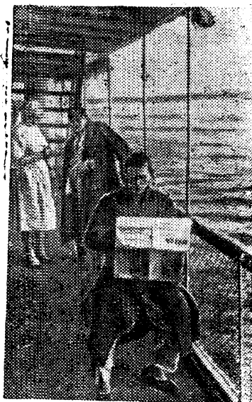
Раненные отдыхают на палубе парохода.