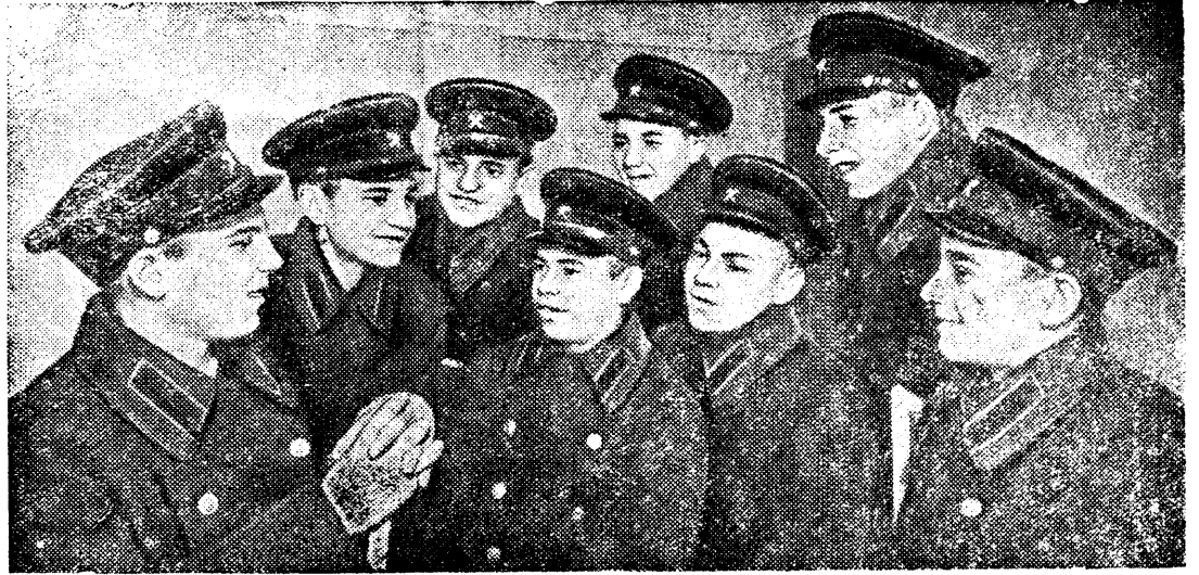
Группа учеников ремесленного училища № 7 при заводе „Динамо“ имени С. М. Кирова (Москва)