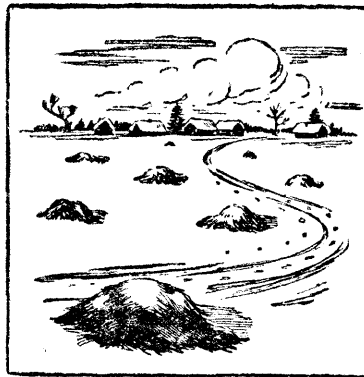
Как не надо складывать навоз в поле.