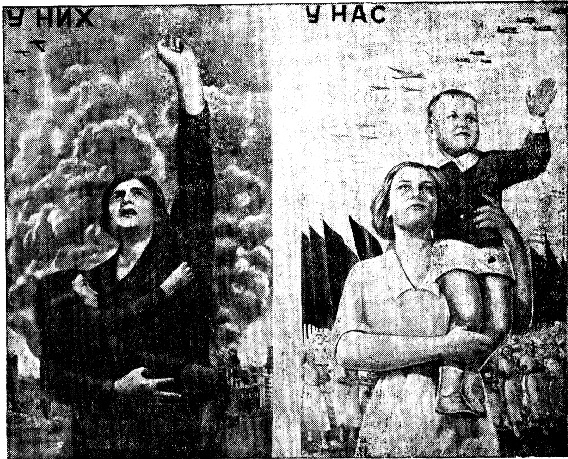
Плакат „У них и у нас“ — работы художника В. Корецкого, выпущенный издательством „Искусство“ к Международному коммунистическому женскому дню.

Вместе со всем народом советские женщины крепят мощь своей страны — отечества трудящихся всего мира.