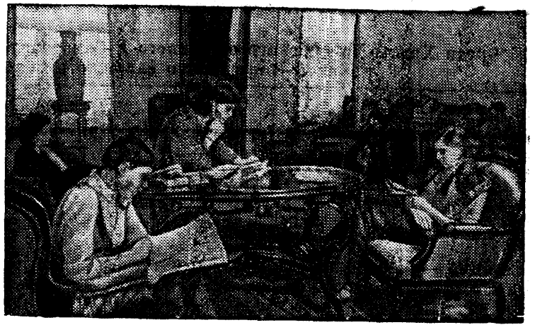
В гостиной Дома отдыха матери и ребенка на Кировских островах (Ленинград).