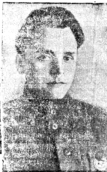
Д. А. Фурманов.