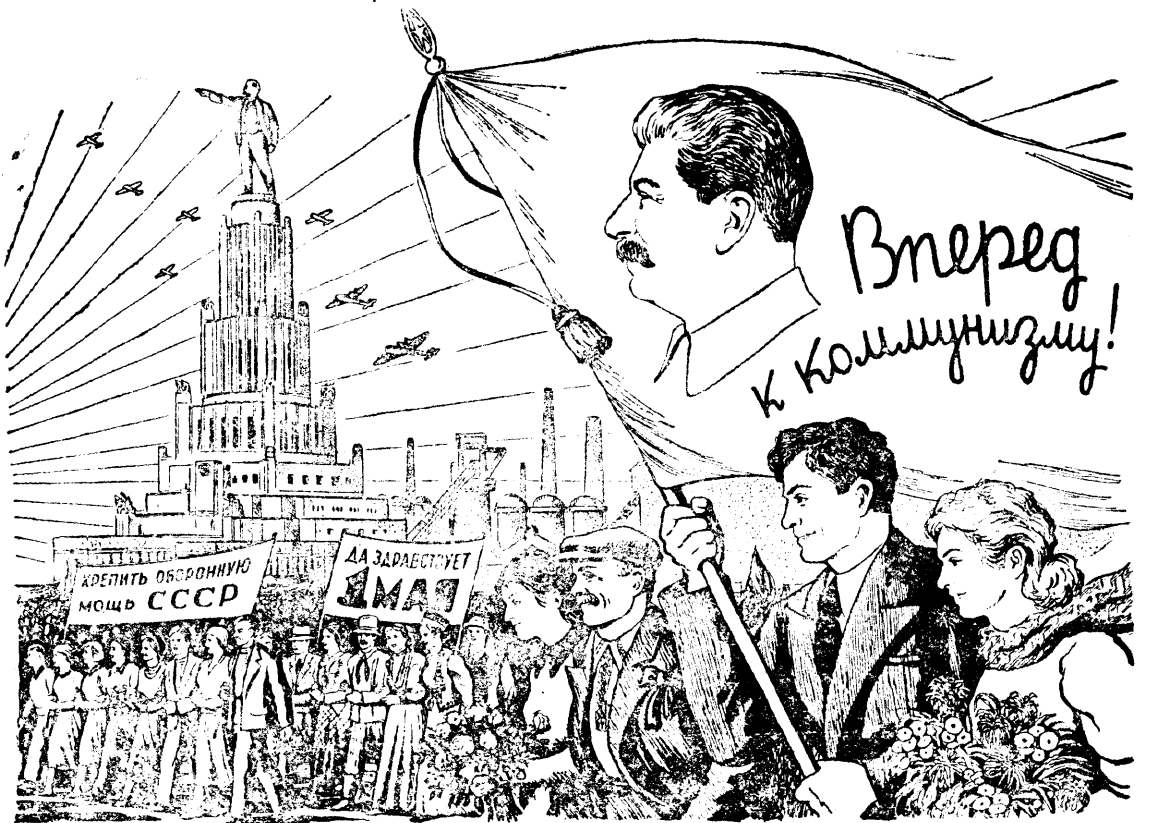
Рисунок Б. Уханова

Да здравствует великое, непобедимое знамя Маркса—Энгельса—Ленина—Сталина! Да здравствует ленинизм!