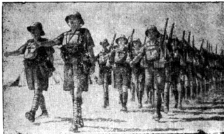
Английские войска на фронте в Западной пустыне (Африка).