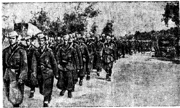
Итальянские войска в Албании