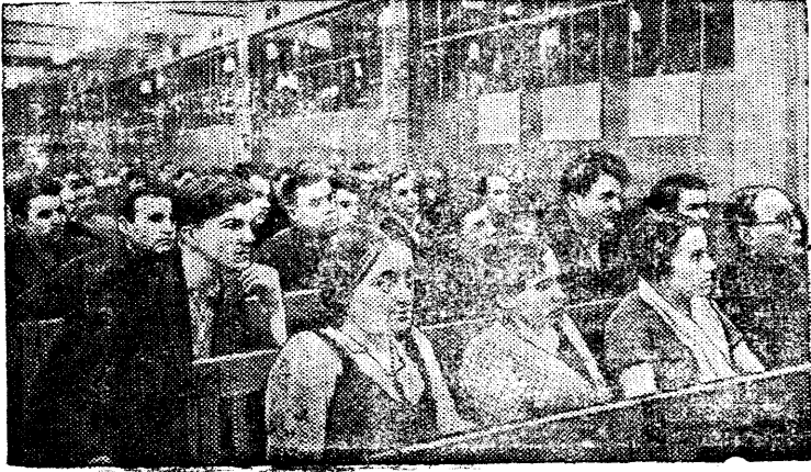
Партсобрание в слесарной цехе № 3.

Отчетно-выборные собрания цеховых партийных организаций на заводе имени Сталина (Москва).