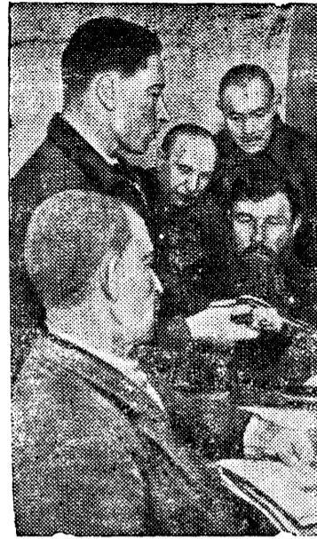
Изучают материальную часть оружия.

Группа старых рабочих, проживающих в доме № 14, на 3-ей Кожуховской улице (Москва), приступила к изучению стрелкового дела.